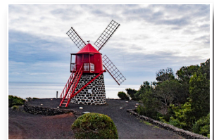
Moinho da Ponta Rasa Ponta Rasa Windmill