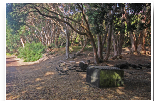
Poço da Maré do Rego Maré do Rego Well