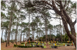
Reserva Florestal Recreio Mistério de S. João Reserva Florestal Recreio Mistério de S. João