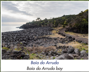
Baía do Arruda Baía do Arruda bay