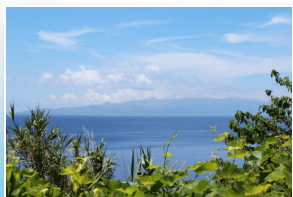
Vista para as ilhas Terceira e Graciosa View to Terceira and Graciosa islands