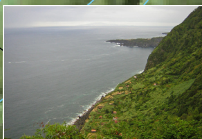
Vista para as Fajãs de Além e do Ouidor View over Fajã de Além and Ouidor